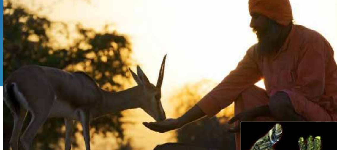
Les Bishnoïs

19H30 Clôture du Festival interuniversitaire du Spectacle Vivant de Lille 3 - Ferme d'en Haut, Villeneuve d'Ascq. Cocktail dinatoire.