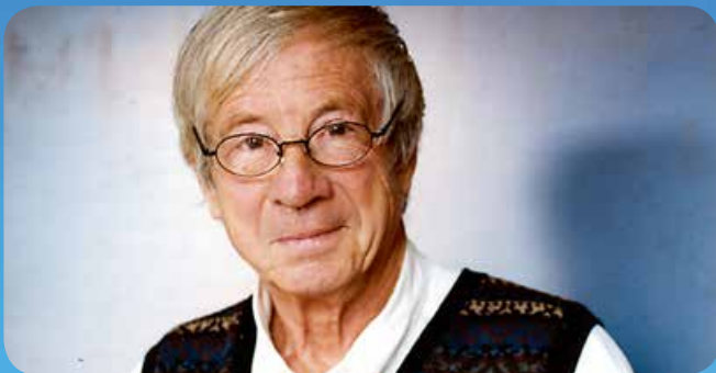
Spectacle de Jean-Louis FOURNIER