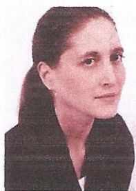
Cynthia Fleury, philosophe « La fin du courage » (Fayard)

Nous sommes tous des cibles. Le message est clair. C'est ainsi que les guerres sont déclarées aujourd'hui. Nous sommes tous des cibles. Ce « nous », ce sont ceux qui croient en la liberté de conscience, en la laïcité, en la séparation revendiquée de la religion et du politique, en l'égalité entre les hommes et les femmes. Ce « nous » qui rassemble ceux qui veulent rester libres et égaux. Charlie Hebdo , c'est l'archétype de cette liberté-là. Atteinte en plein cœur des hommes. Attentat dans l'ordre et sans sur-