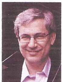
Orhan Pamuk, Prix Nobel de littérature

Je suis extrêmement triste. Je comprends la tristesse et la colère du peuple et des intellectuels français. Devant la tuerie et la terreur, les défenseurs de la liberté de parole, de la démocratie, des droits de l'homme et de la dignité humaine doivent s'unir, tenir bon, être forts. Ce qui vient de se passer est aussi un coup très dur porté à ceux d'entre nous qui ont toujours cru que les peuples des pays qui ont l'islam pour croyance et ceux de l'Europe chrétienne pouvaient vivre pa-